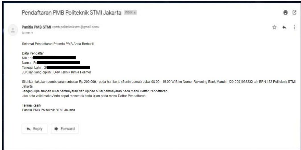
Gambar 9 Notifikasi Via E-Mail

Notifikasi akan otomatis terkirim jika pada saat pendaftaran email yang diinput merupakan email yang aktif. Setelah itu silahkan lakukan pembayaran biaya pendaftaran sebesar Rp 200.000,- ke No Rekening Bank Mandiri 120-0091035332 a/n BPN 182 Politeknik STMI Jakarta.